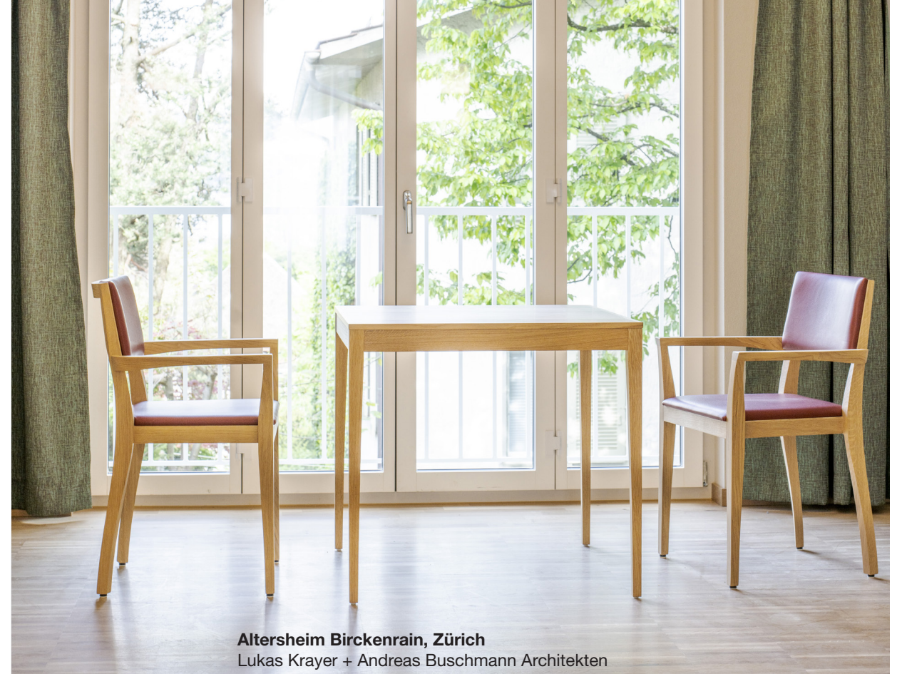
Altersheim Birckenrain, Zürich Lukas Krayer + Andreas Buschmann Architekten