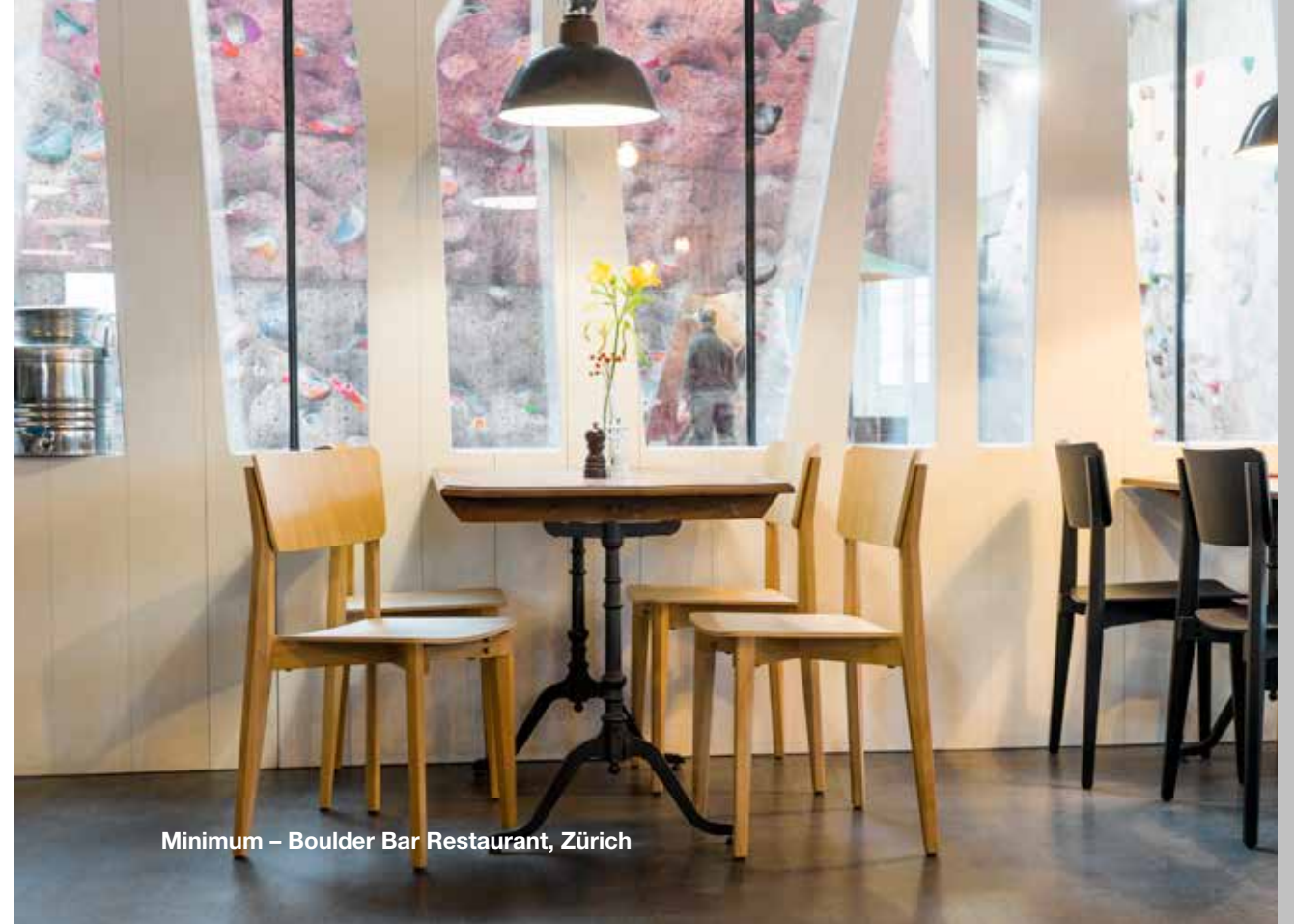
Minimum – Boulder Bar Restaurant, Zürich