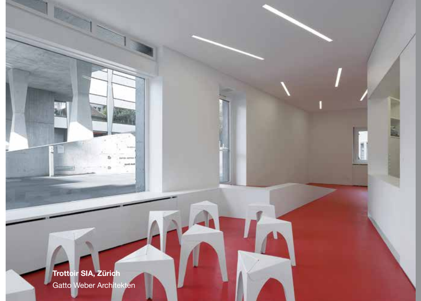
Trottoir SIA, Zürich Gatto Weber Architekten