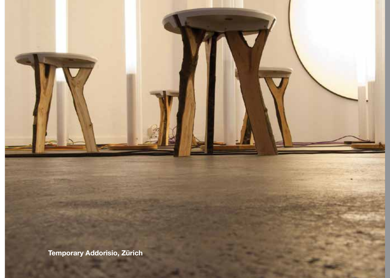
Temporary Addorisio, Zürich