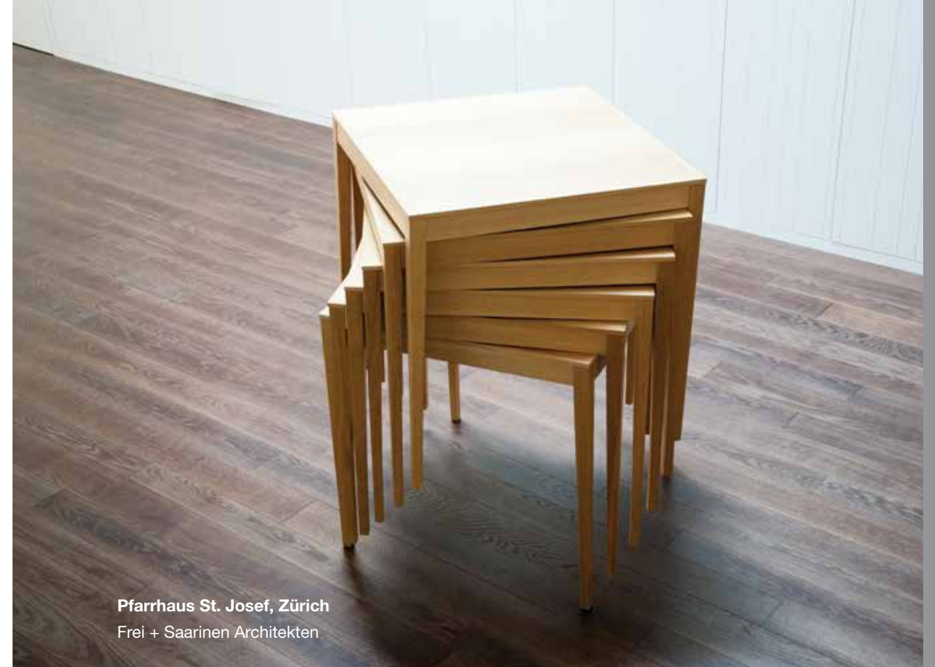
Pfarrhaus St. Josef, Zürich Frei + Saarinen Architekten