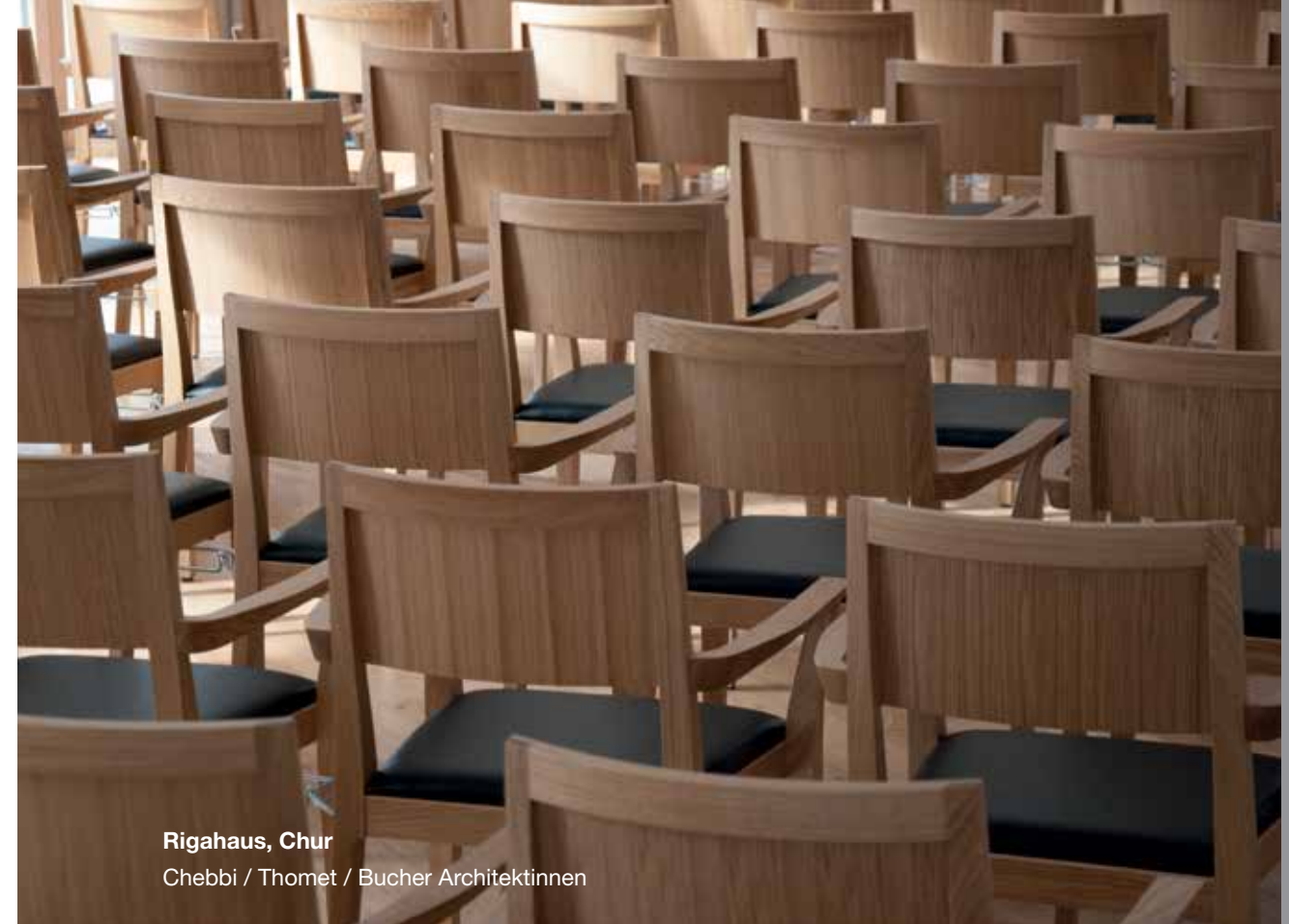
Rigahaus, Chur Chebbi / Thomet / Bucher Architektinnen

Der Flankenschnitt-Stuhl F/08 bietet durch die breite Sitzfläche guten Sitzkomfort und die lange Rückenlehne entlastet den Rücken besonders gut. Zudem vermindert er die Stolpergefahr, da die Hinterbeine nicht über den äussersten Punkt der Rückenlehne hinausragen.