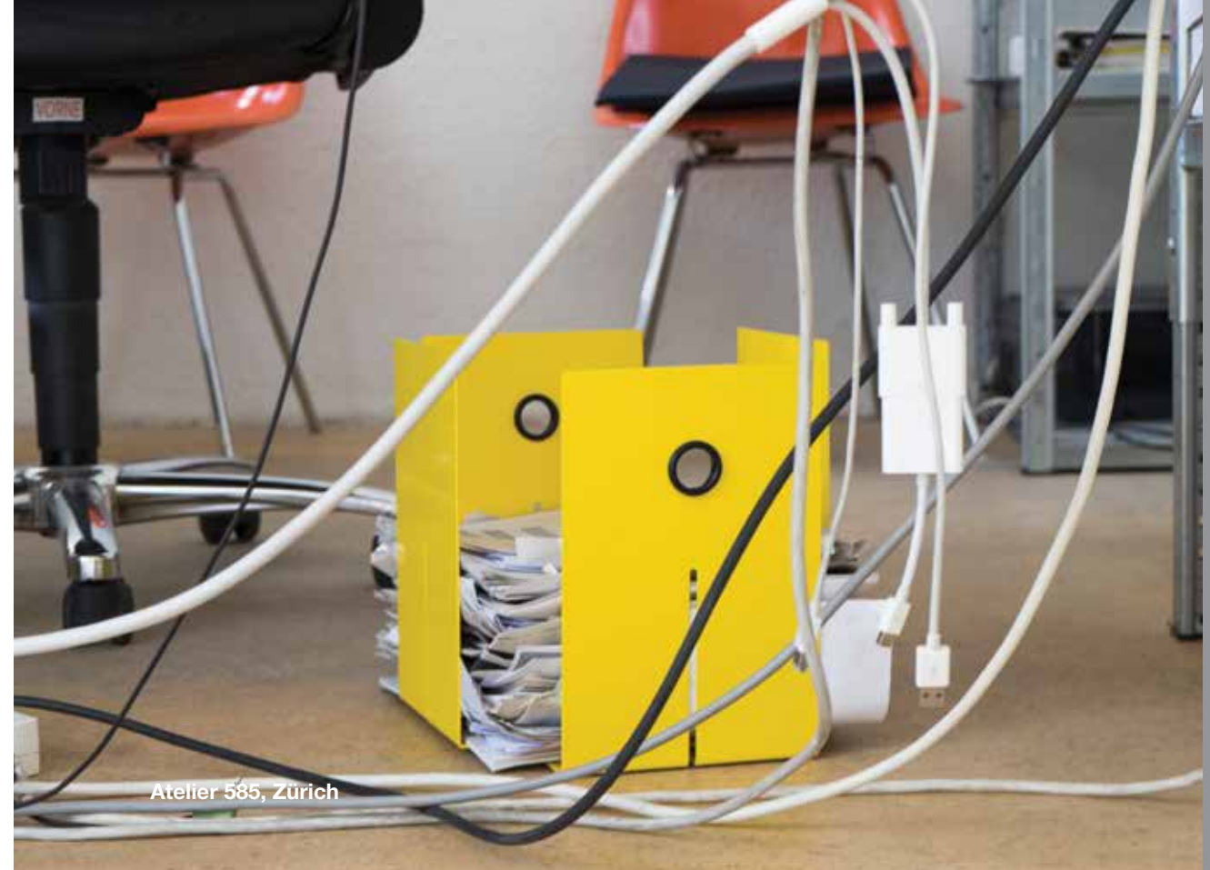
Atelier 585, Zürich