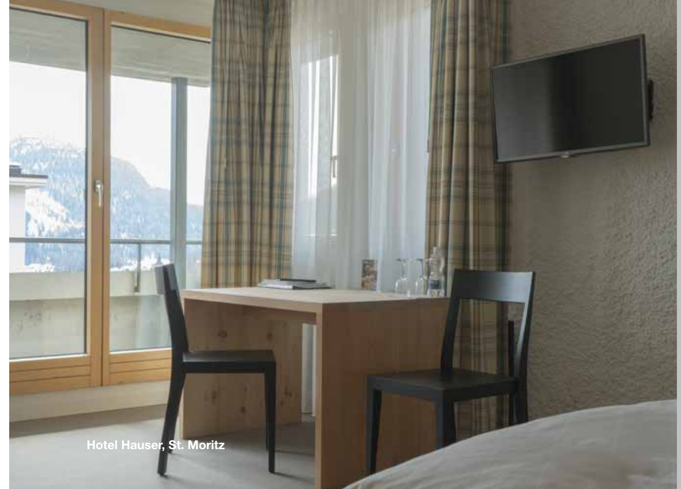
Hotel Hauser, St. Moritz

Der Flankenschnitt-Stuhl F/01 überzeugt mit schlichter Erscheinung und gutem Sitzkomfort.