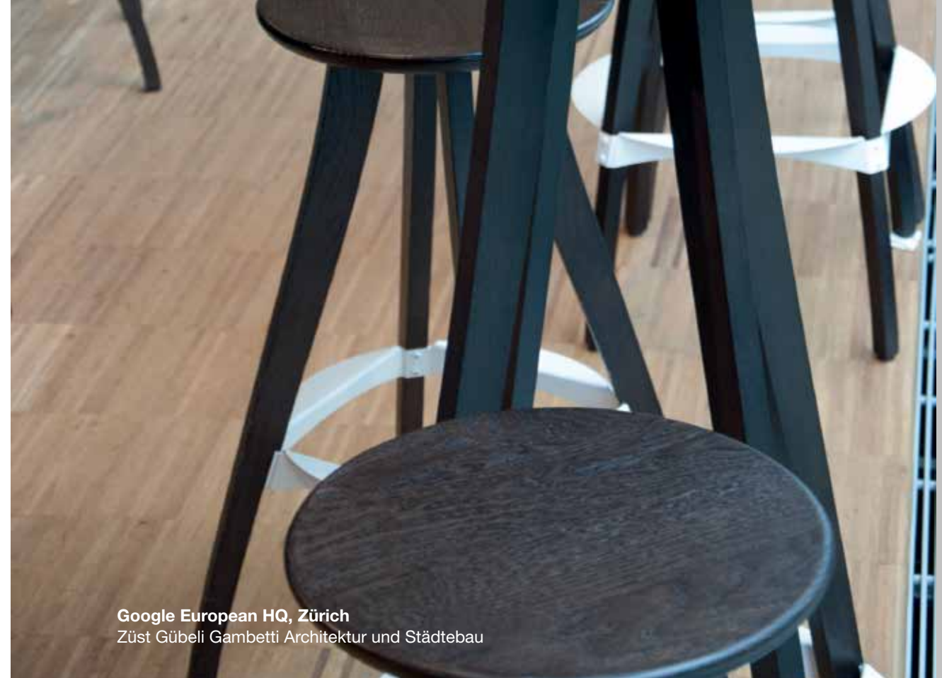
Google European HQ, Zürich Züst Gübeli Gambetti Architektur und Städtebau