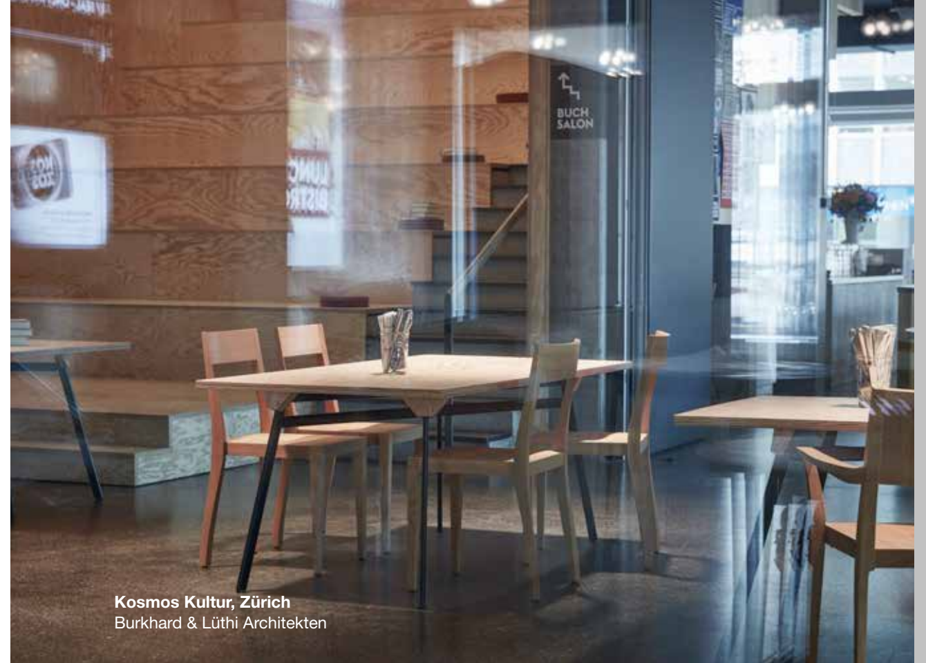
Kosmos Kultur, Zürich Burkhard & Lüthi Architekten