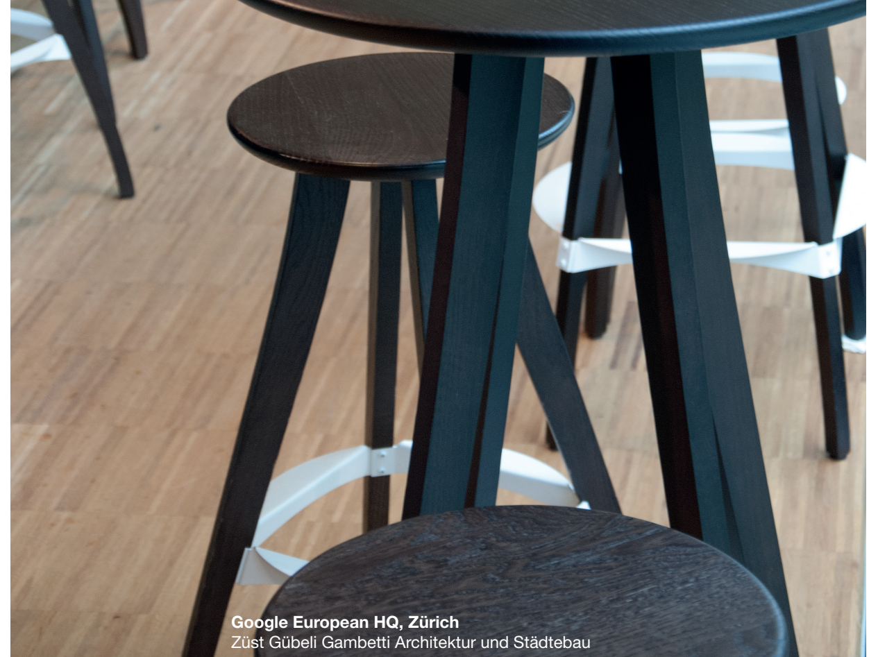
Google European HQ, Zürich Züst Gübeli Gambetti Architektur und Städtebau