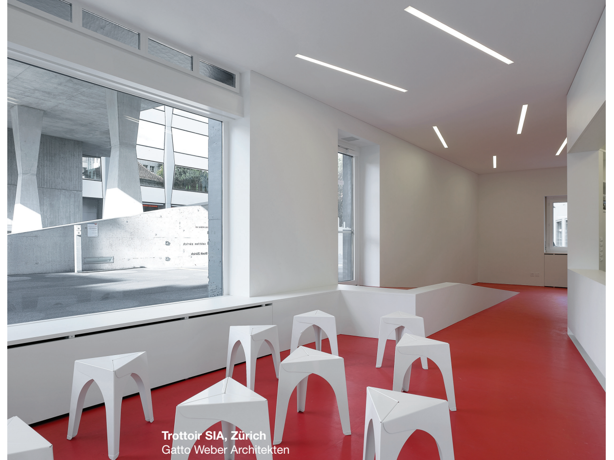
Trottoir SIA, Zürich Gatto Weber Architekten