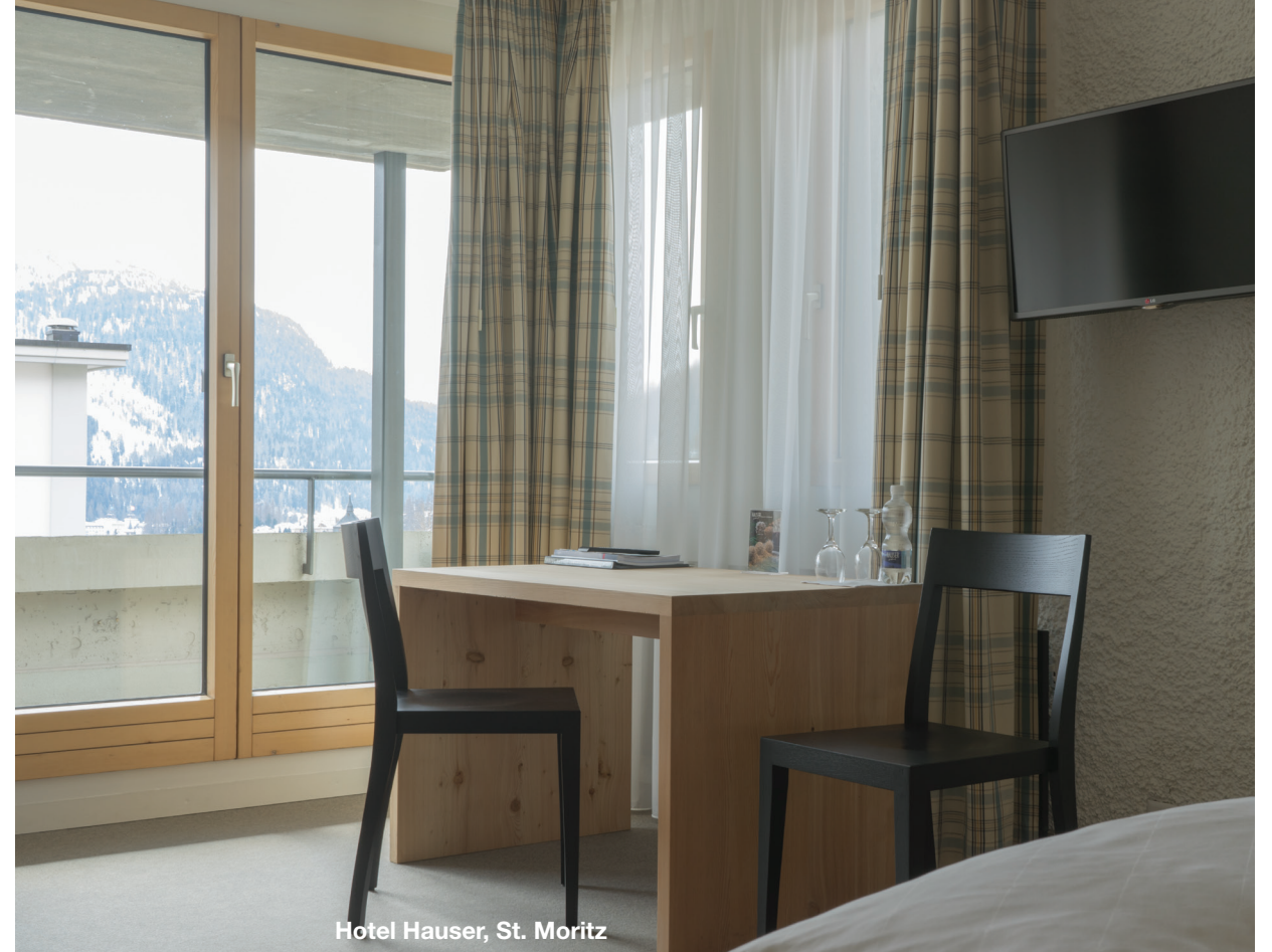
Hotel Hauser, St. Moritz