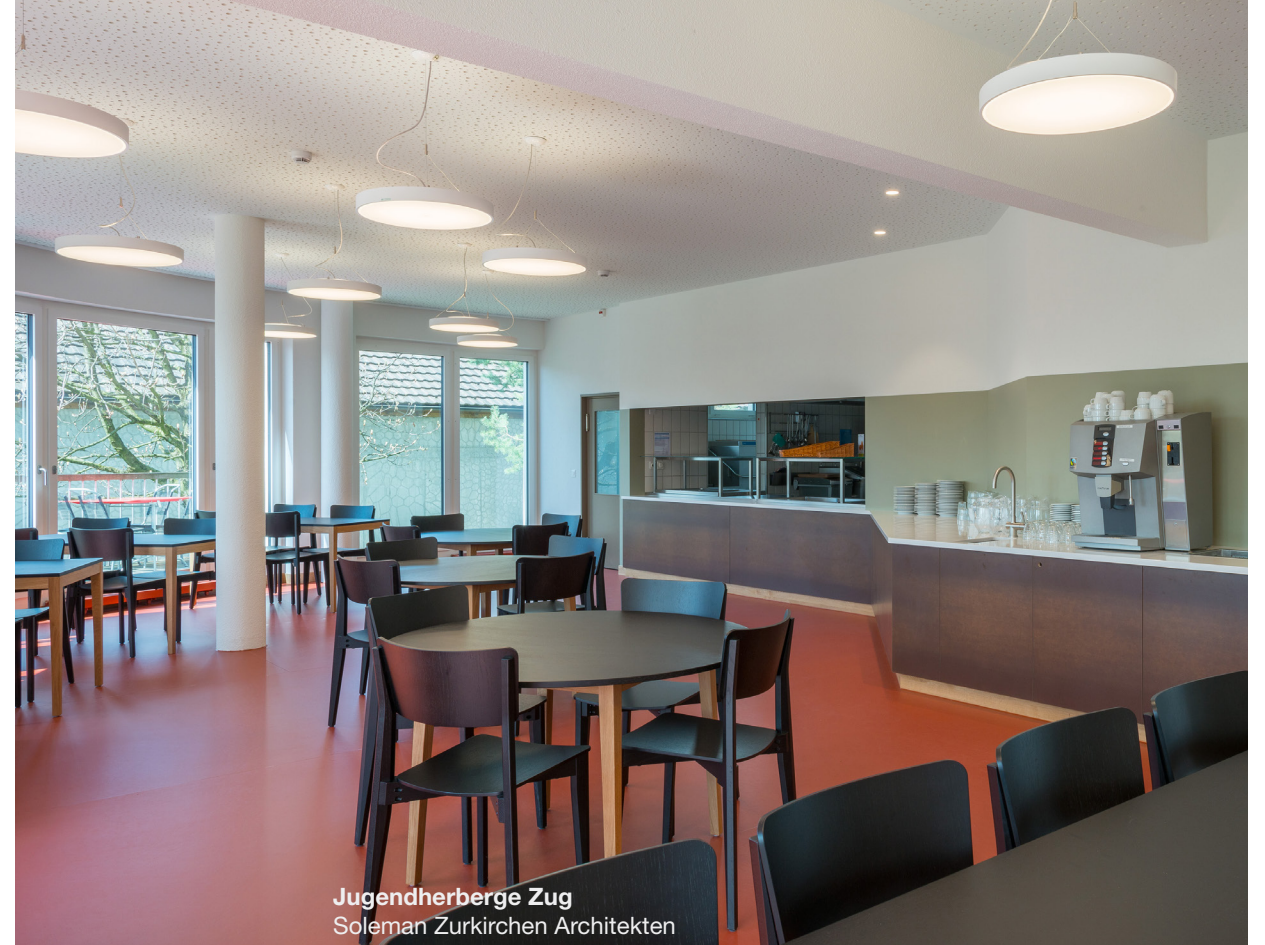
Jugendherberge Zug Soleman Zurkirchen Architekten