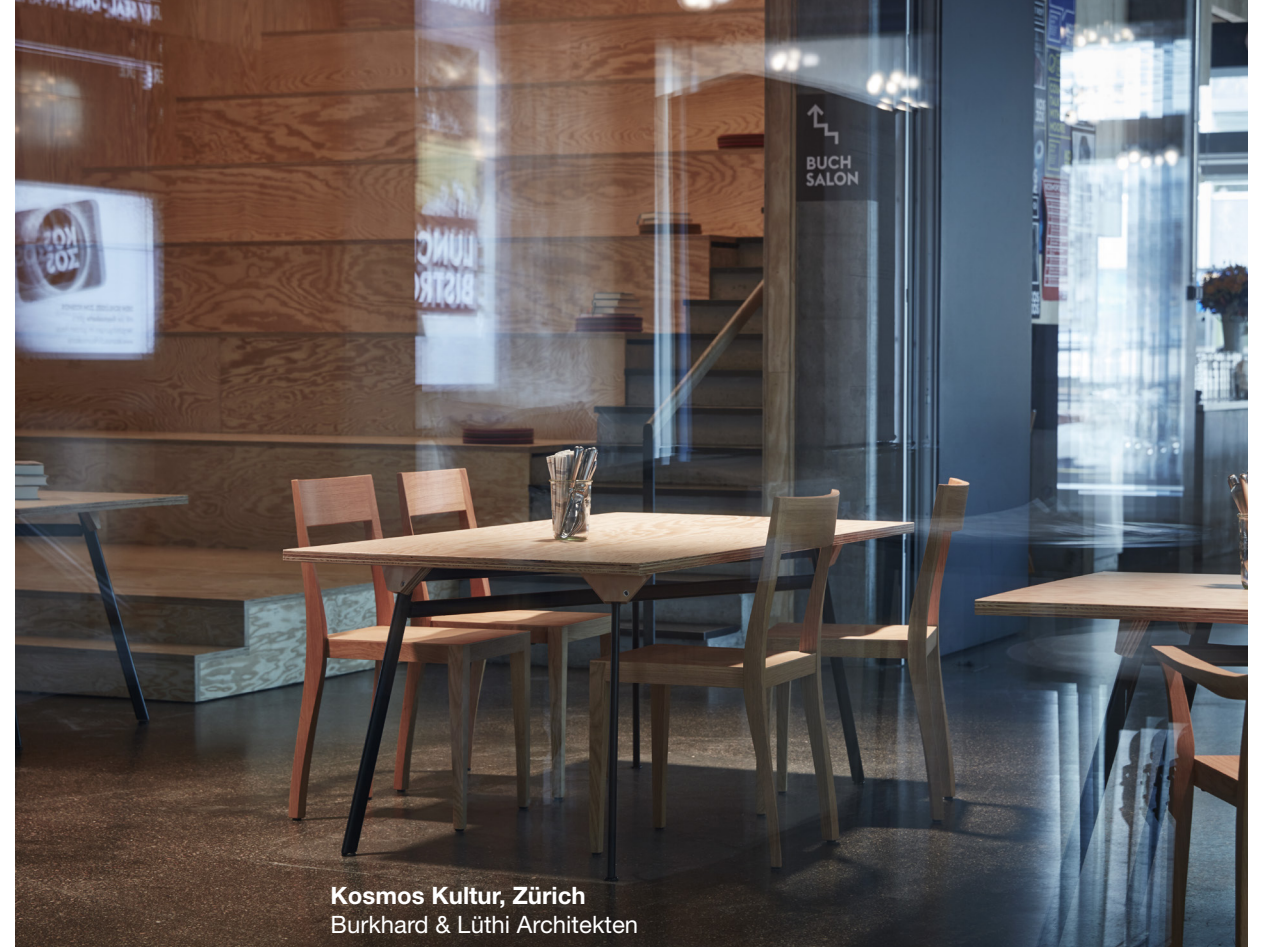
Kosmos Kultur, Zürich Burkhard & Lüthi Architekten