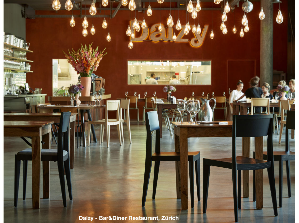
Daizy - Bar&Diner Restaurant, Zürich