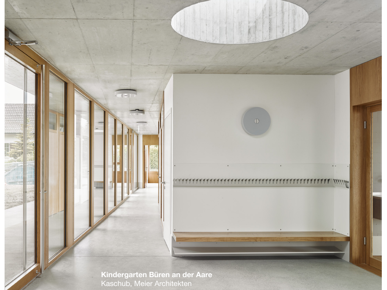
Kindergarten Büren an der Aare Kaschub, Meier Architekten