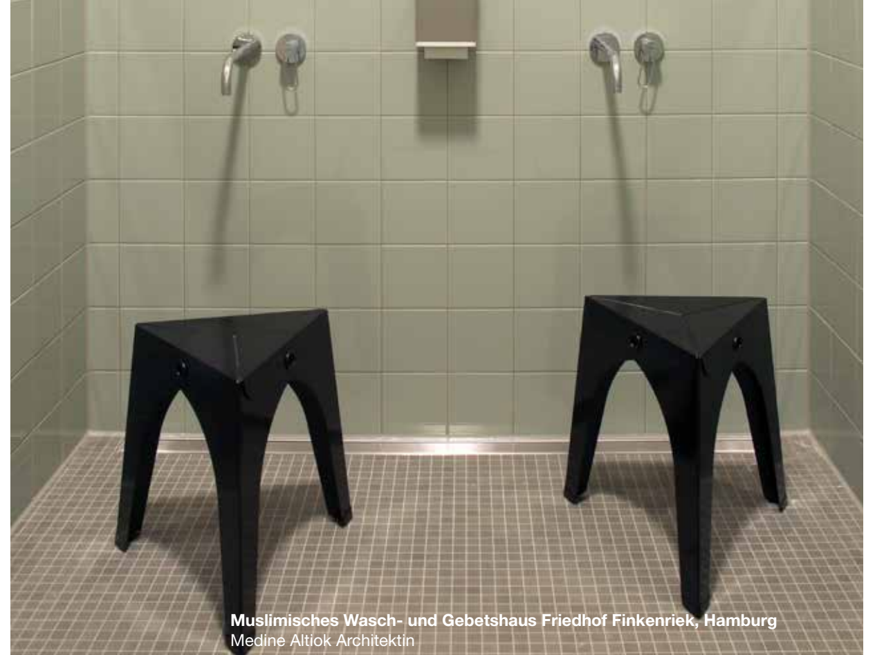
Muslimisches Wasch- und Gebetshaus Friedhof Finkenriek, Hamburg Medine Altiok Architektin