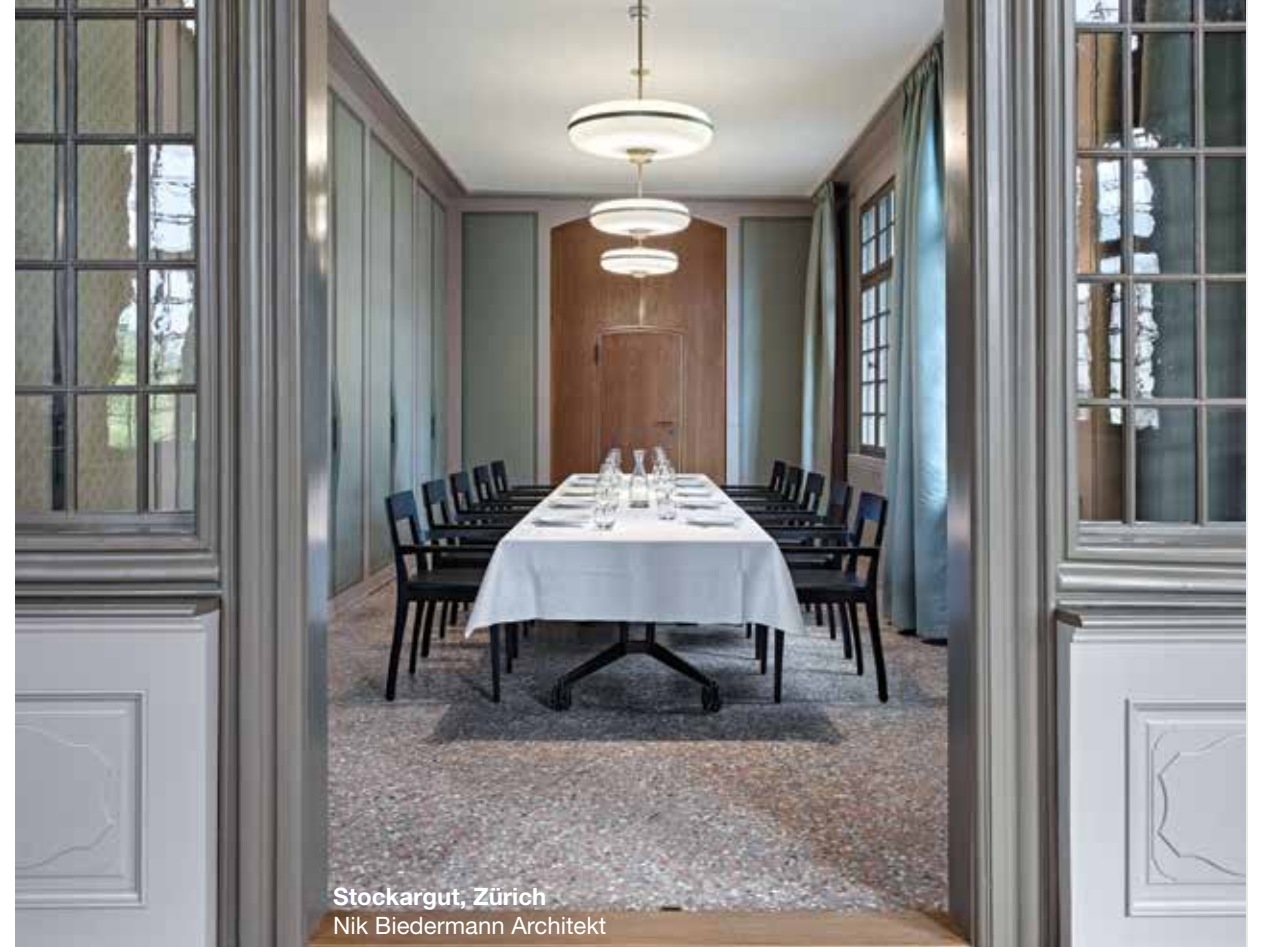
Stockargut, Zürich Nik Biedermann Architekt