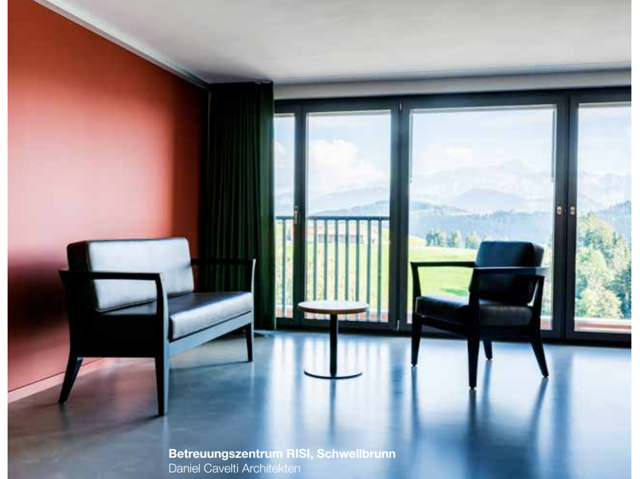
Betreuungszentrum RISI, Schwellbrunn Daniel Cavelti Architekten