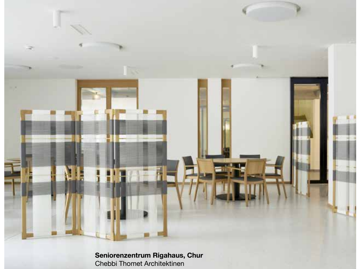
Seniorenzentrum Rigahaus, Chur Chebbi Thomet Architektinnen

Wählbare Farbe der Kunststoffschnüre – ab 20 Stück