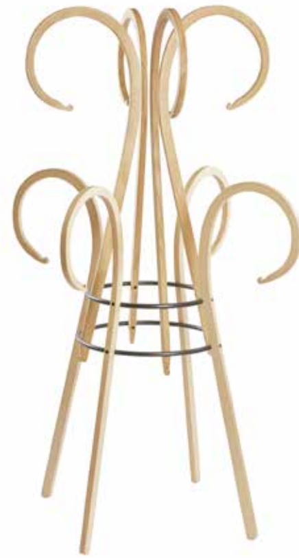
WA/ ROSEBUD KLEIDERLEISTE