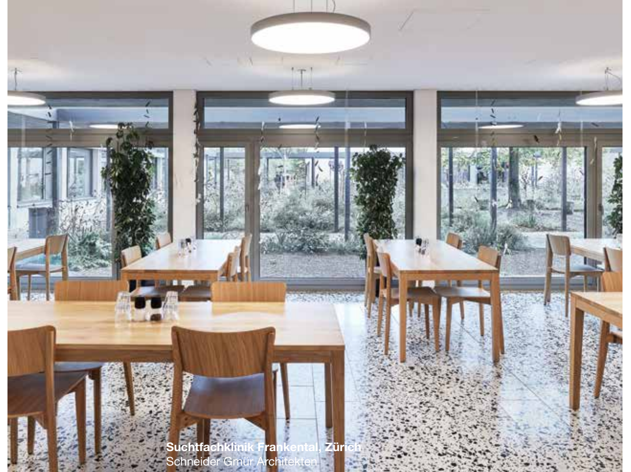
Suchtfachklinik Frankental, Zürich Schneider Gmür Architekten