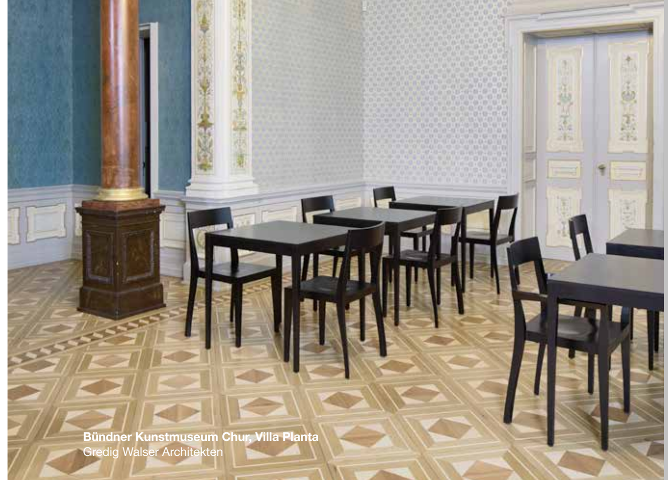
Bündner Kunstmuseum Chur, Villa Planta Gredig Walser Architekten