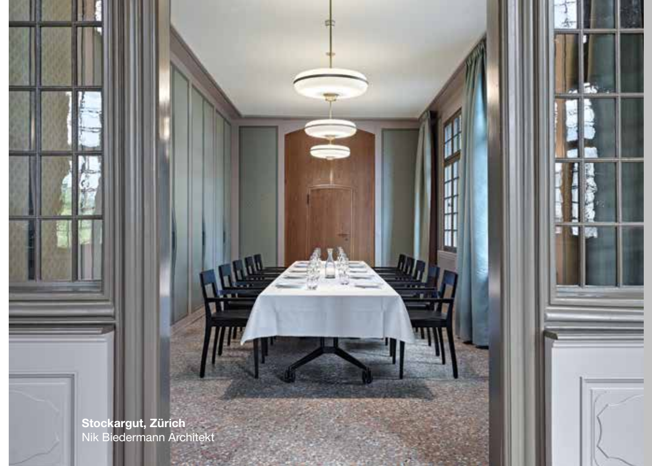
Stockargut, Zürich Nik Biedermann Architekt