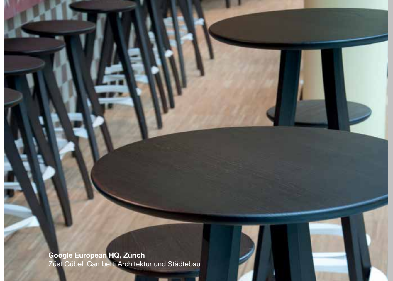
Google European HQ, Zürich Züst Gübeli Gambetti Architektur und Städtebau