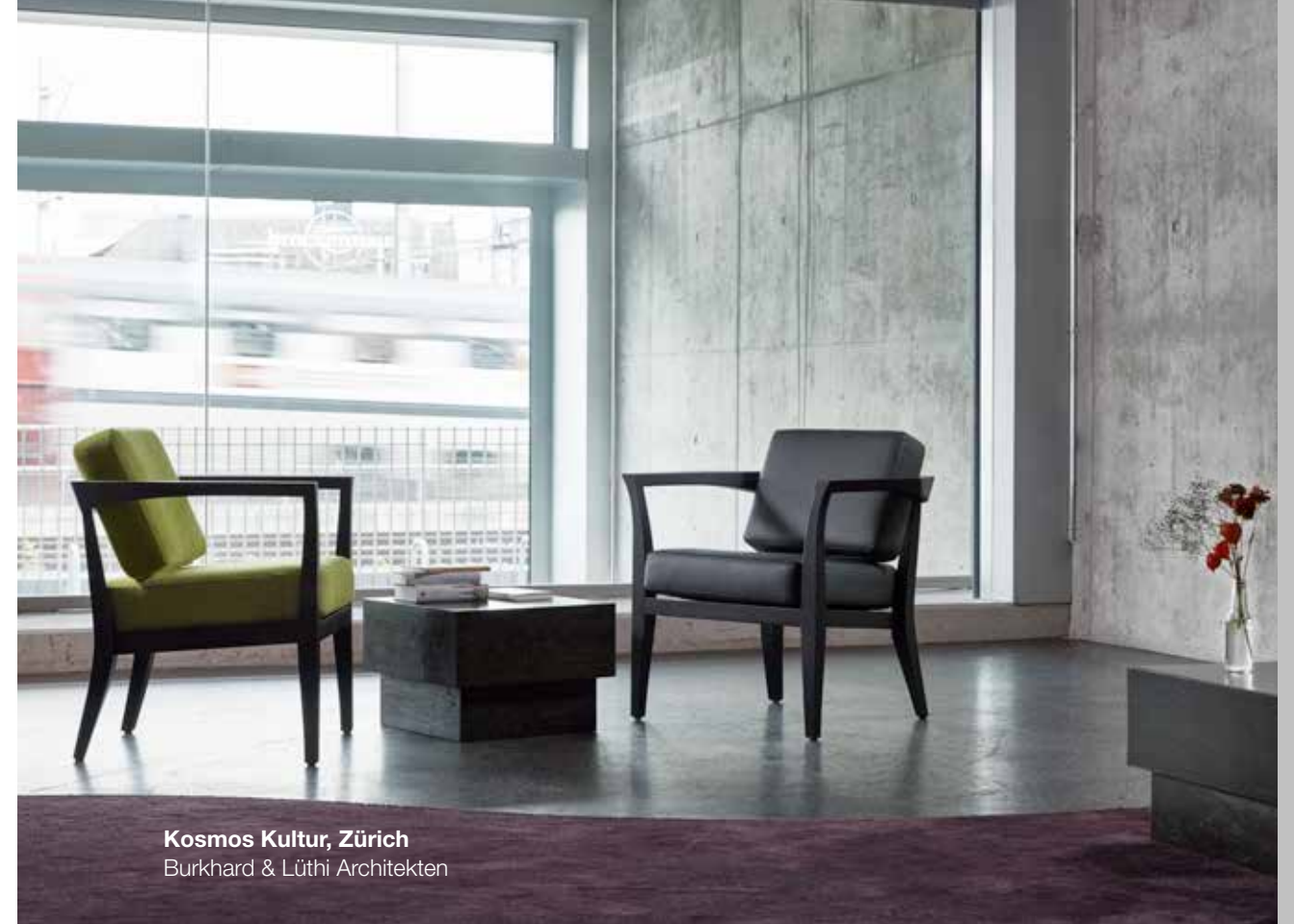
Kosmos Kultur, Zürich Burkhard & Lüthi Architekten